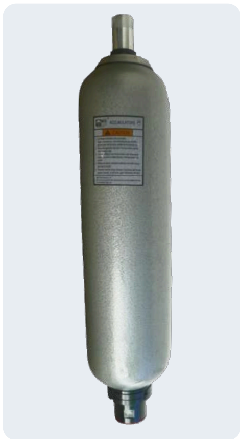
Внешний вид гидроаккумулятора серия NXQ-A